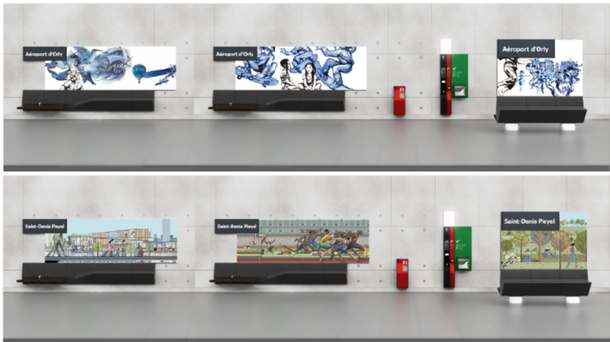
設置事例：1、エドモン・ボードワンー オルリー空港駅（14号線）2、セルヒオ・ガルシア・サンチェスー サン＝ドニ・プレイエル駅（14号線）