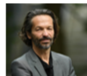
Emmanuel TIBLOUX, directeur de l'École nationale supérieure des arts décoratifs